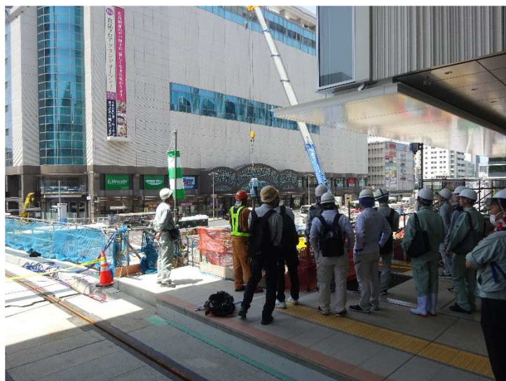
【 路面電車ホーム側よりエールエル A 館を望む 】