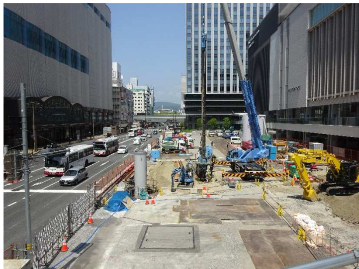
【 バスエリア側工事状況 】