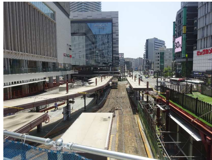
【 マイカーエリア側工事状況 】