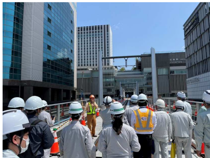
【駅前大橋線橋りょう ①】