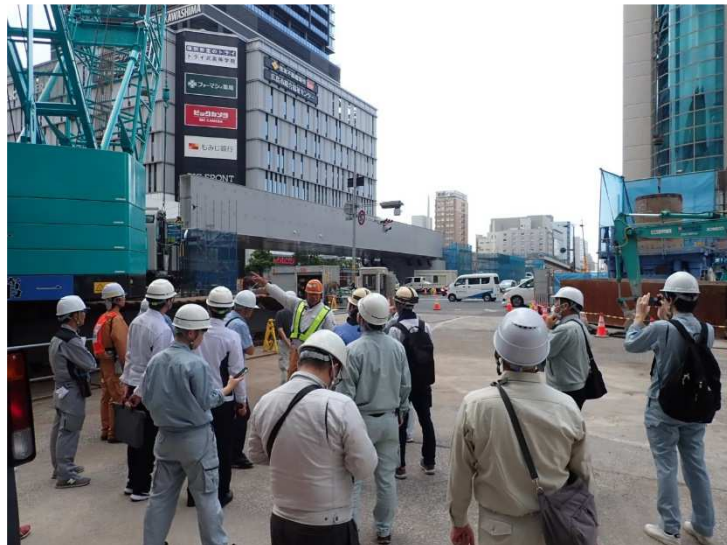
【大洲通り架設状況 ①】