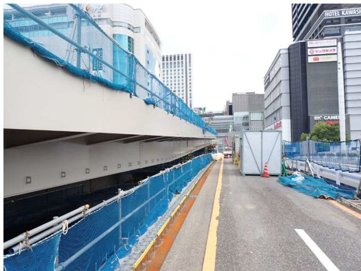
【駅前大橋軌道桁 架設状況 ①】