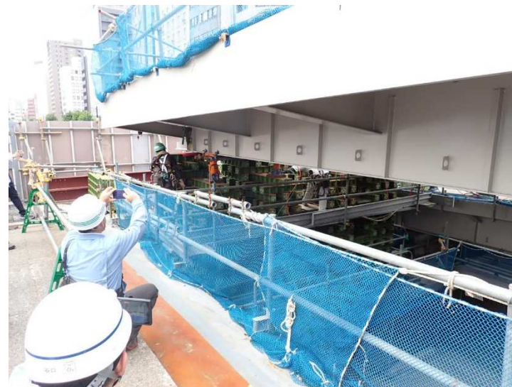
【駅前大橋軌道桁 架設状況 ②】